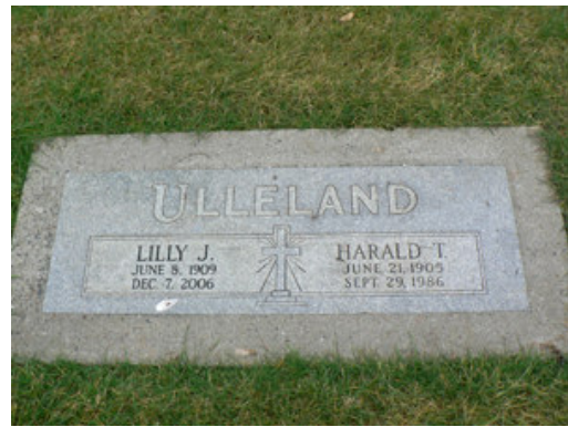
Sisters and brothers